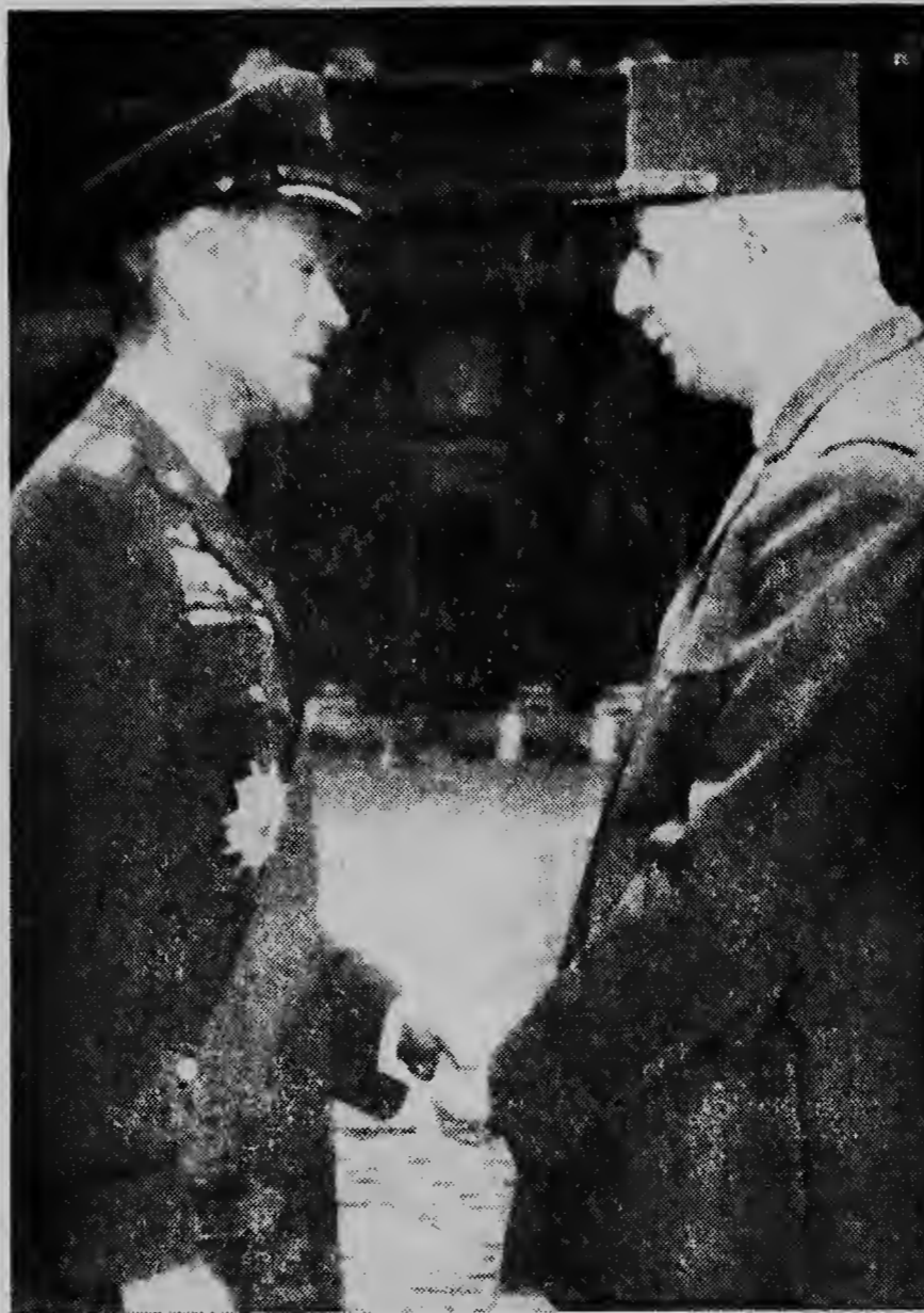
President Charles de Gaulle di Francia durante un solemnidad na Paris a entrega e comandante supremo di NAVO cu a bai cu retiro, general Norstad, e cruz di legion di honor, un distincion frances pa militarman.

RAWALPINDI, 29 dec. — Pakistan y India a dicidi pa continua e actual deliberacionnan tocante e kestion di Kasjmier dia 16 y 17 di januari proximo na New Delhi. Representantenan di India y Pakistan, a anuncia esaki awe na e dj dos dia di nan deliberacionnan tocante Kasjmier. Den circulanon Indio di delegacion nan a bisa, cu durante e deliberacionnan nan a haci bon progreso. Den circulanon di Pakistan nan no tahata asina entusiastista, pero nan a declara cu e deliberacion lo continua.